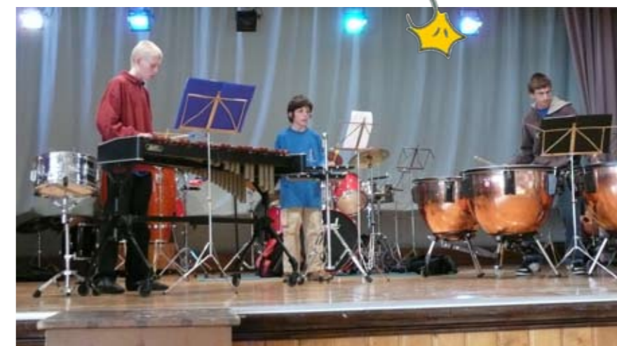
Le groupe de percussion à la finale Vaudoise des solistes et petits ensembles