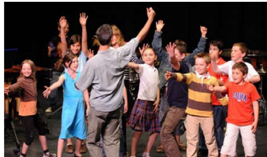
La classe I de solfège et quelques élèves de percussions chantent pour nous!